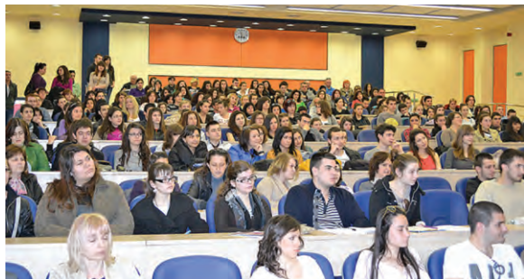
Участници в деня на кандидат-студента

ция, беше актуализиран съобразно новия правилник за устройството и дейността на университета. Представители на отдел „Учебни дейности“ и отдел „Международно сътрудничество“ участва-