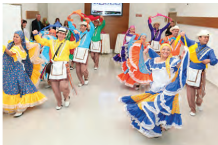
Танц на гостите от Колумбия

Новата учебна година се предпоставаше от посещението на световноизвестния професор по неврохирургия, пластична хирургия, онкология и педиатрия д-р Бен Карсън от болница „Джонс Хопкинс“ в Балтимор, САЩ. По покана на зам.-ректора доц. Б. Китов на 12.09. т.г. той изнесе вдъхновяващата лекция „Допустимо поемане на риск в неврохирургията“. В нея бяха представени невероятни клинични случаи на разделяне на сямски близнаци, свързани в главата, с помощта на „надарените ръце“ на талантливия лекар. Хирургът със забележителна кариера и биография е олицетворение на сбъднатата американска мечта – „момче от гетото“ става неврохирург с „божествени ръце“.