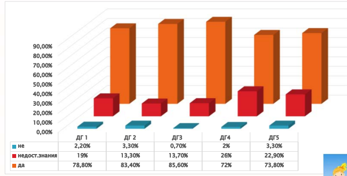
Фиг.2. Отн. дял на родители с различно ниво на здравни познания

Здравните теми, които интересуват родителите, и по които биха искали да обогатят и задълбочат знанията си са посочени на фиг. 3, а предпочитаните източници на здравна информация - на фиг. 4 :