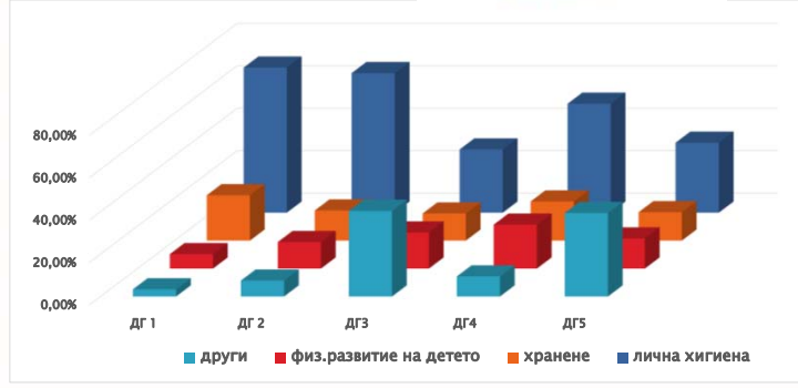
Фиг.3. Актуални здравни теми