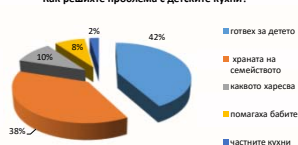
Как решихте проблема с детските кухни?

Резултати и обсъждания: Една трета (36,68%) от анкетираните родители са се притеснили от затварянето на детските кухни. 80,47% от участниците в проучването винаги са оценявали какво удобство и отмяна е детската кухня.