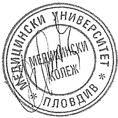
ГРАФИК за поправителна изпитна сесия на специалност „ Медицински лаборант ” зимен семестър на учебната 2020 / 2021 година 01.02 до 07.02.2021 година